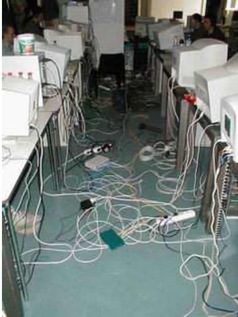
LAN = Local Area Network