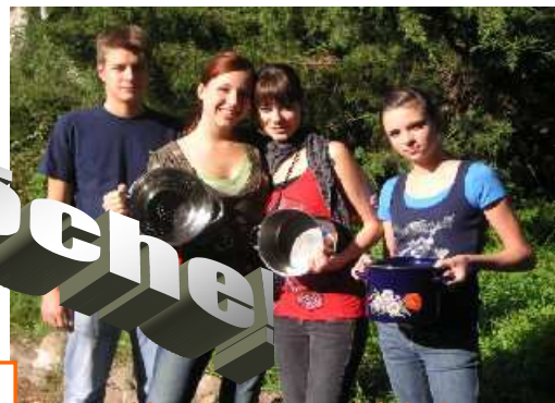
Bericht von der Klassenfahrt 10