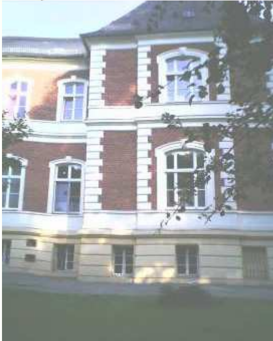
Teilansicht des Schlosses Calberwisch